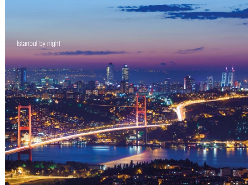
Istanbul by night