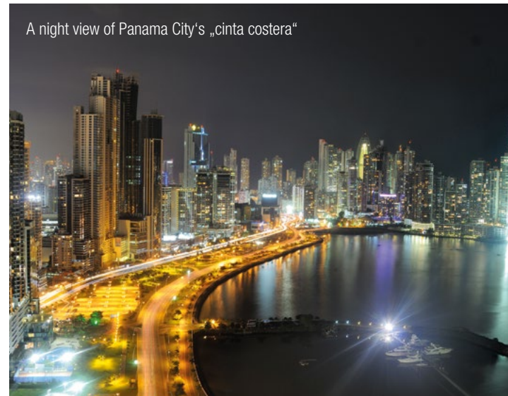
A night view of Panama City's „cinta costera“

Our competent InterGest partners will assist you in over 50 countries, from Canada to New Zealand, where a team of around 750 employees currently provides consulting services to approximately 1,700 branches of international companies.