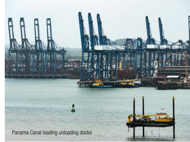
Panama Canal loading unloading docks