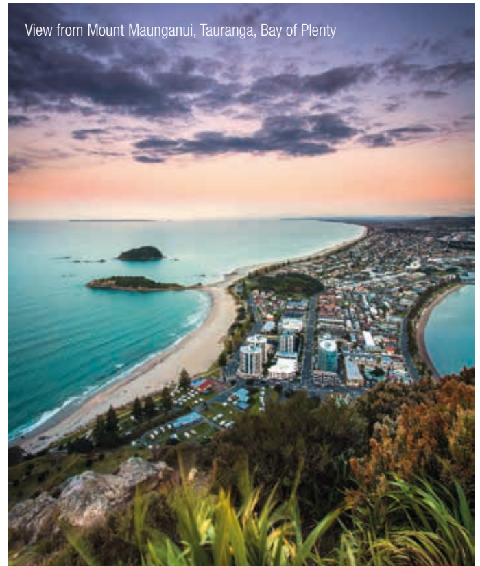
View from Mount Maunganui, Tauranga, Bay of Plenty

Our experienced InterGest partners will assist you in over 50 countries, from Canada to New Zealand, where a team of around 750 employees currently provides consulting services to approximately 1,700 branches of international companies.