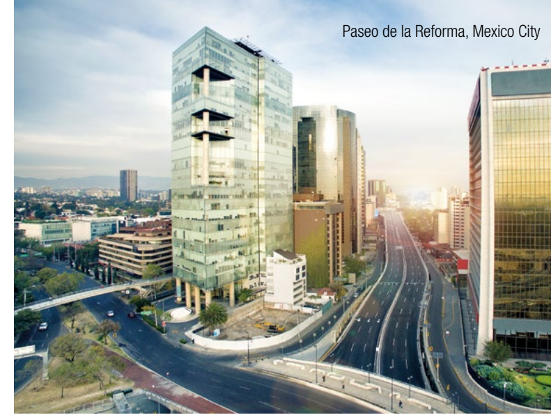
Paseo de la Reforma, Mexico City