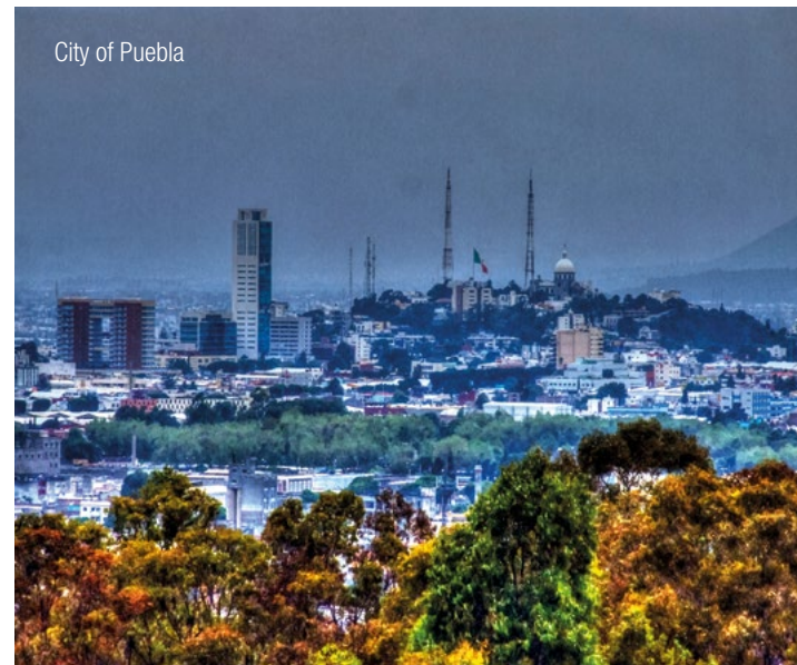
City of Puebla

Our competent InterGest partners will assist you in over 50 countries, from Canada to New Zealand, where a team of around 750 employees currently provides consulting services to approximately 1,700 branches of international companies.