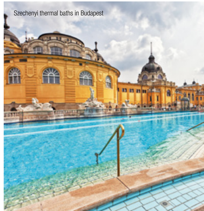
Szechenyi thermal baths in Budapest

Our competent InterGest partners will assist you in over 50 countries, from Canada to New Zealand, where a team of around 750 employees currently provides consulting services to approximately 1,700 branches of international companies.