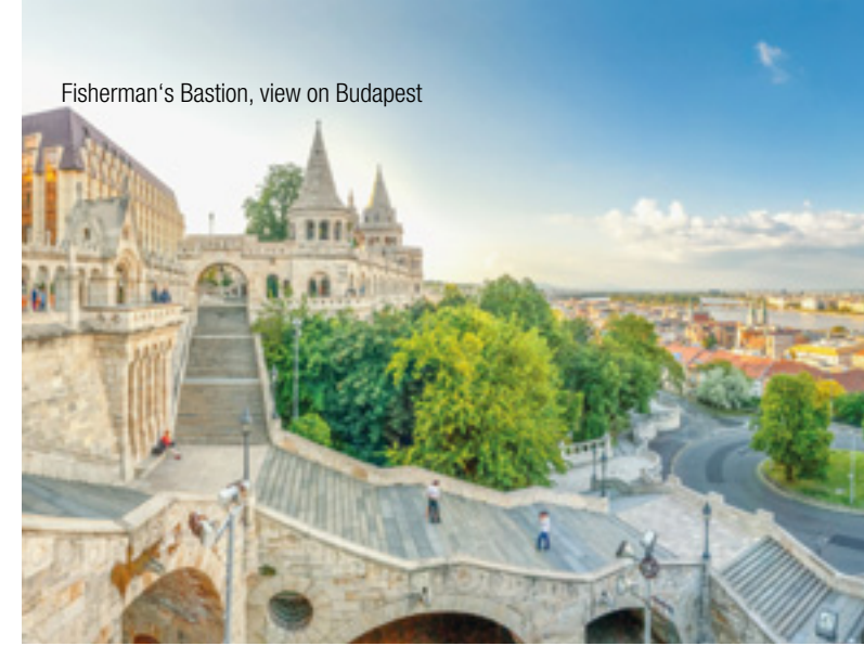
Fisherman's Bastion, view on Budapest